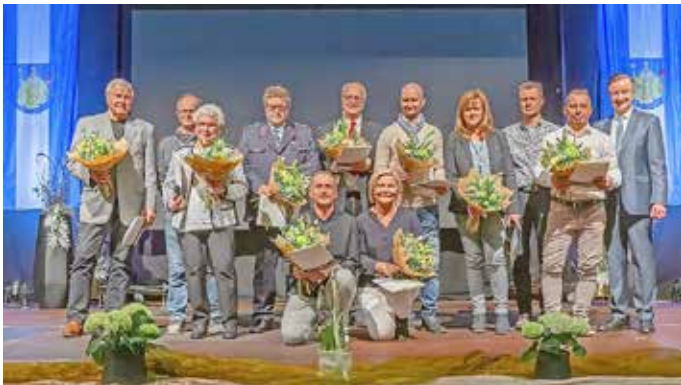
Beim Jahresempfang der Stadt und der Bundeswehr wurden elf Bürgerinnen und Bürger ausgezeichnet.