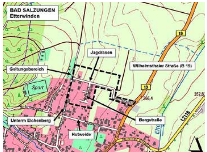
Übersichtslageplan mit Geltungsbereich (schwarz gestrichelt) des Bebauungsplan Nr. 1 Wohngebiet „Hutweide / Jagdrasen“ - Stadt Bad Salzungen (Kartengrundlage: WEBAtlasDE ©; Quelle: „Geoproxy Thüringen“; ohne Maßstab)

Das Plangebiet liegt im Ortsteil Etterwinden. Der Geltungsbereich wird im Westen von der Straße „Unterm Eichenberg“ begrenzt. Südlich schließt sich die bebaute Ortslage mit der Straße „Hutweide“ an. Im Osten wird das Plangebiet überwiegend von einer Grünfläche begrenzt. Lediglich im Bereich der Straße „Jagdrasen“ verläuft dieser bis an die „Wilhelmsthaler Straße“ heran. Im Norden schließt sich eine Grünfläche an das Plangebiet an. Im Geltungsbereich befinden sich die Straßen „Jagdrasen“ und „Bergstraße“.