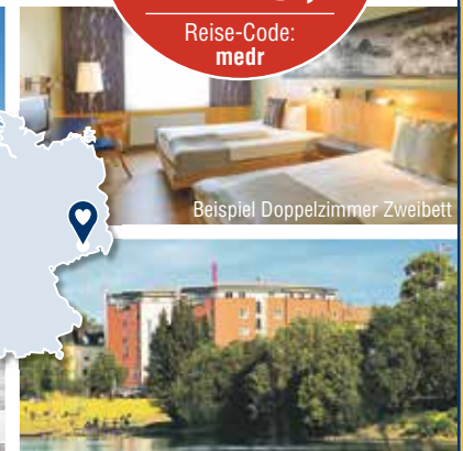
Beispiel Doppelzimmer Zweibett