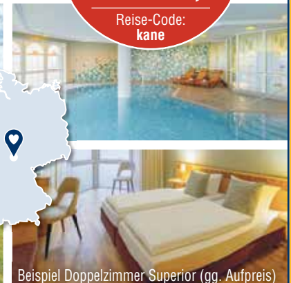
Beispiel Doppelzimmer Superior (gg. Aufpreis)