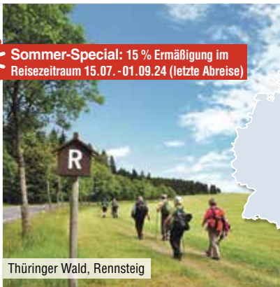
Thüringer Wald, Rennsteig

Preise ggf. zzgl. Terminzuschlag. Einzelzimmerzuschlag: 30 €/Nacht Kurtaxe: ca. 2 € pro Person/Nacht