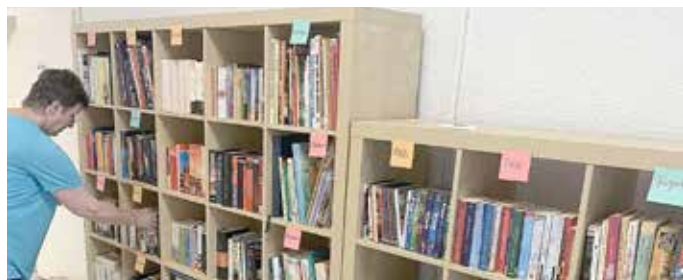
Große Auswahl an Büchern und CDs im Büchertauschregal. Hier können Bücher kostenlos mitgenommen und gut erhaltene eingestellt werden.

Auch eine Büchertauschbörse ist im Sozialkaufhaus integriert, hier gibt es Bücher vieler Genre.