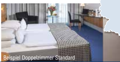
Beispiel Doppelzimmer Standard